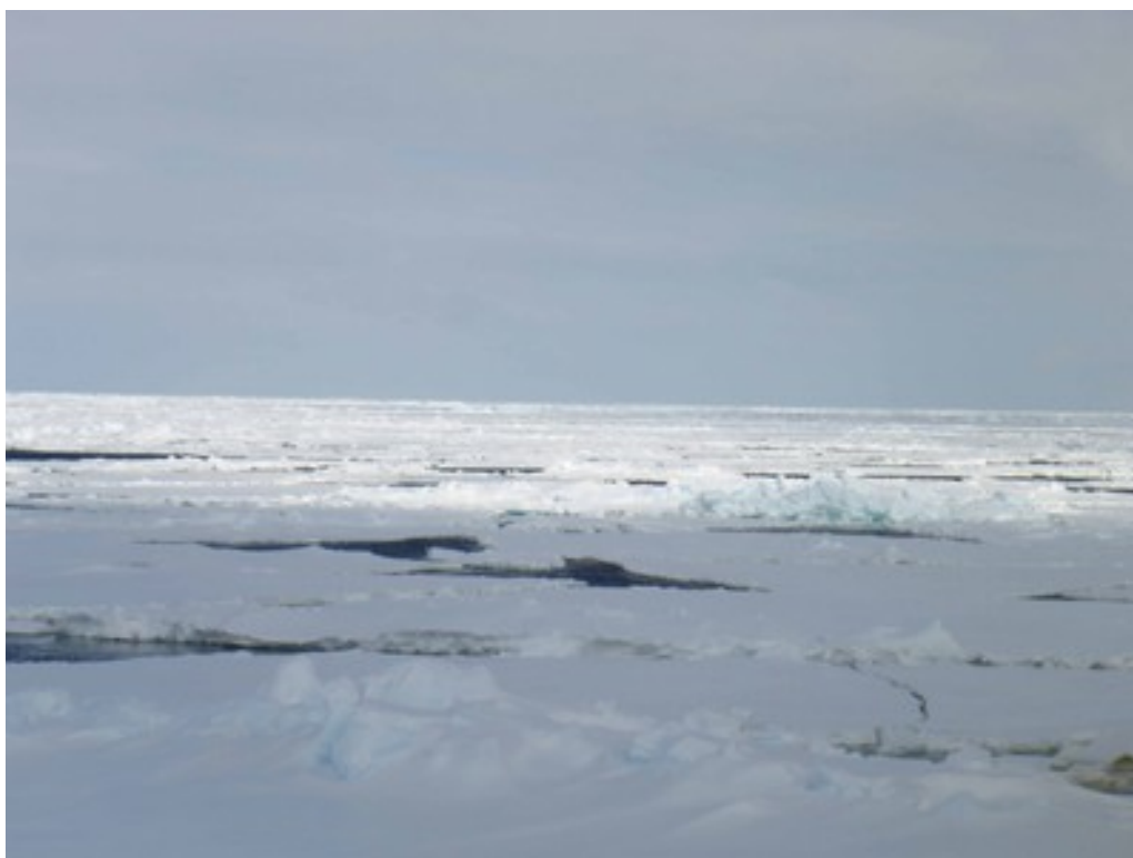
Foto 6: Lastroni di pack molto compatti e a perdita d'occhio. La nave ha dovuto procedere con estrema cautela