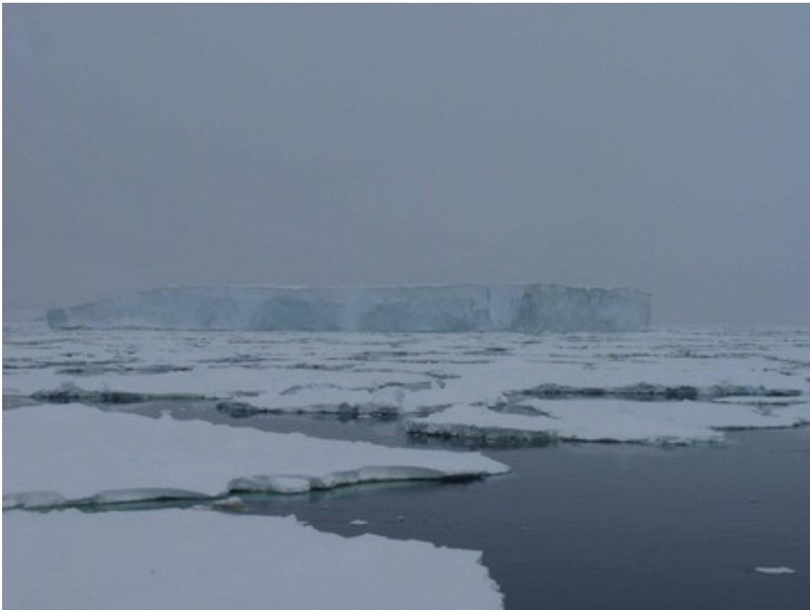
Foto 8: Iceberg al largo di dimensioni enormi (molto più grande della nostra nave). A Natale abbiamo attraversato un campo di Iceberg avvistandone a decine