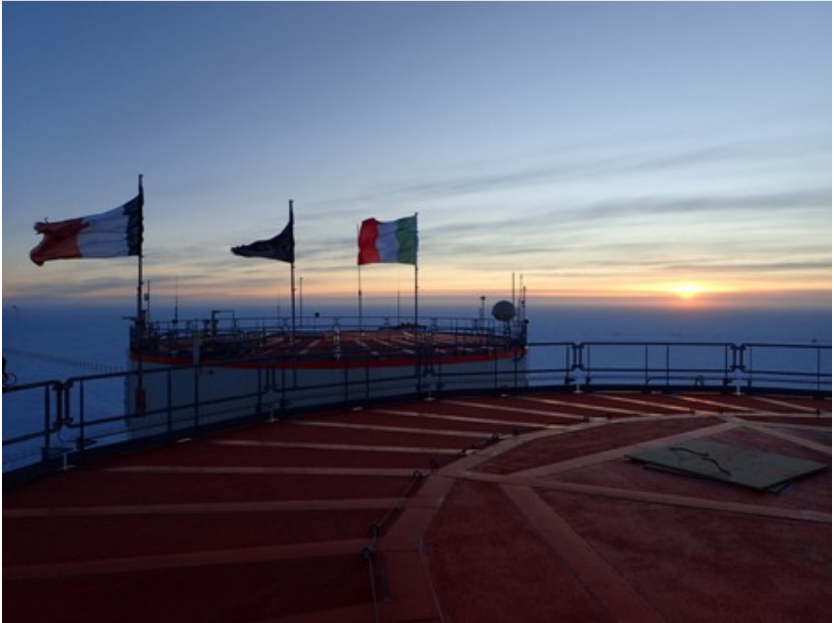
Foto 25: Tramonto visto dal tetto