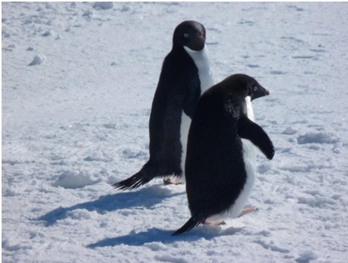
Foto 11: Due pinguini sul pack davanti alla stazione Mario Zucchelli