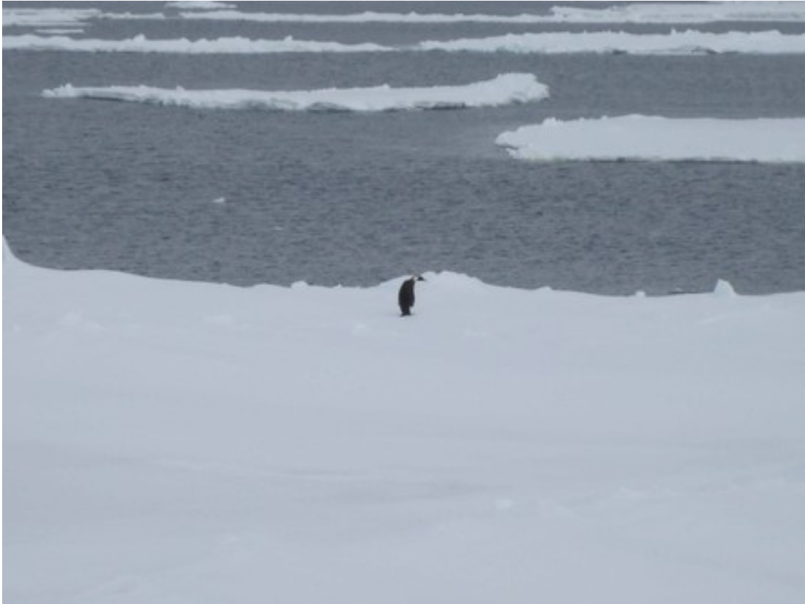
Foto 7: Pinguino imperatore sul pack a migliaia di chilometri dalla costa