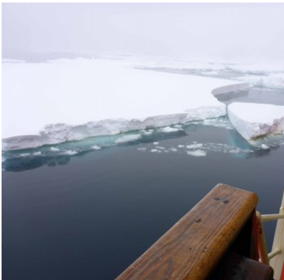
Foto 5: Lastroni di ghiaccio del pack spessi più di un metro. La nave Italice nella sua marcia (lenta) lo ha spinto rompendolo

Alessandro ed Elvio vi regalano le successive bellissime foto.