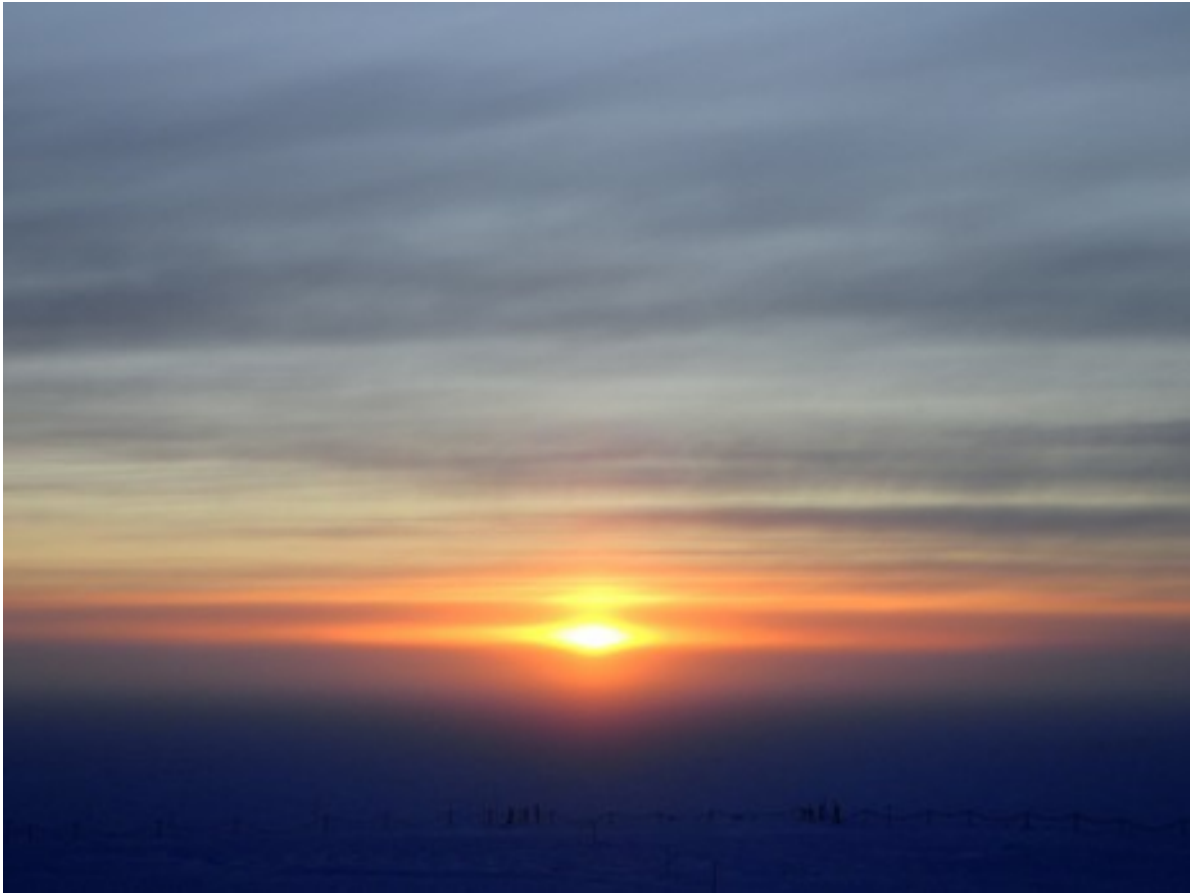
Foto 22: Effetti del sole al tramonto