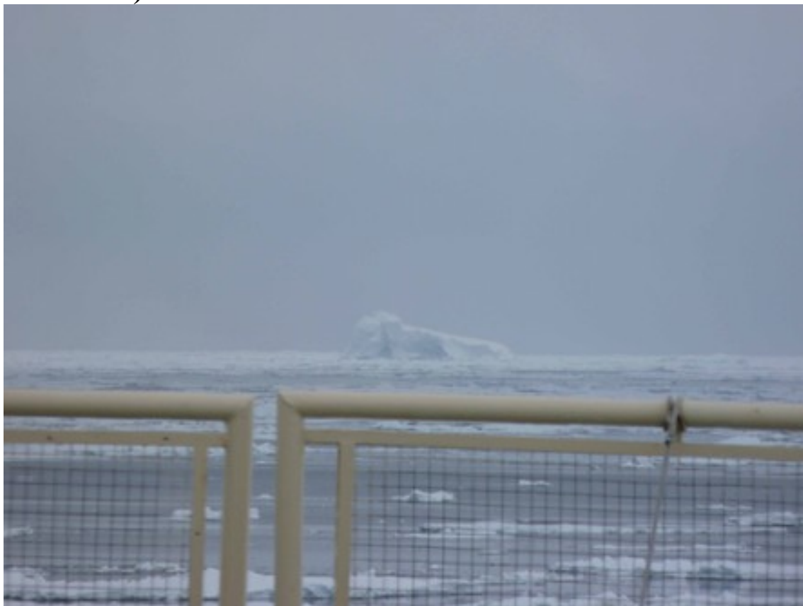
Foto 9: Iceberg più piccolo del precedente ma più grosso della nostra nave (la ringhiera ha dimensioni normali)