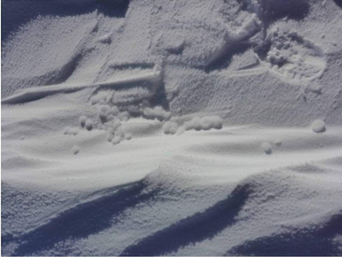
Foto 29: Yukimarimo ovvero piccolissime palline di neve soffice. Queste avevano un diametro massimo di un centimetro