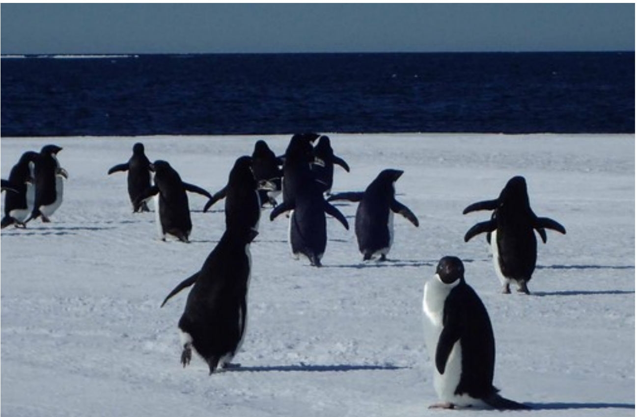
Foto 16: Un pinguino Adelia curioso