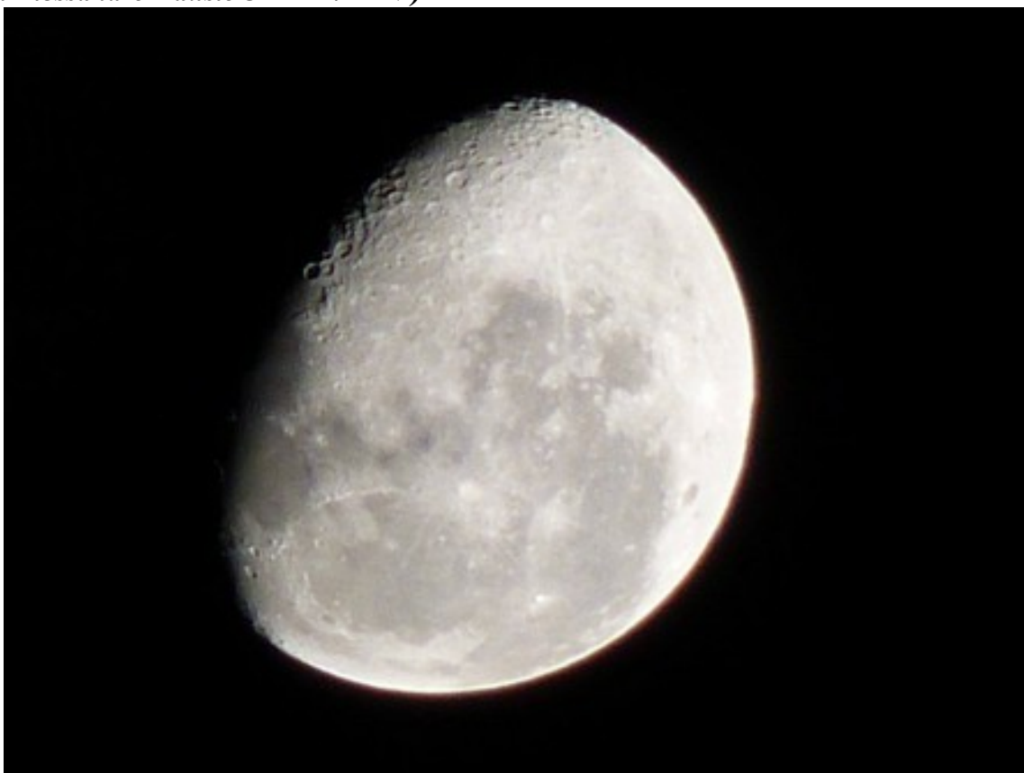
Foto 33: Luna e suoi crateri