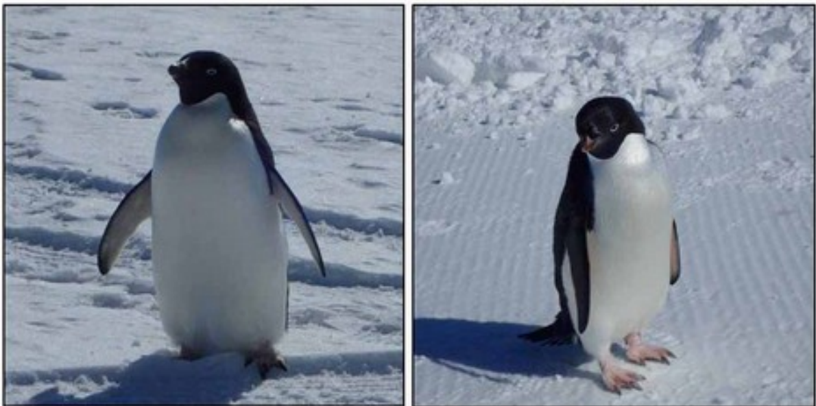
Foto 18: Confronto fra pinguini Adelia