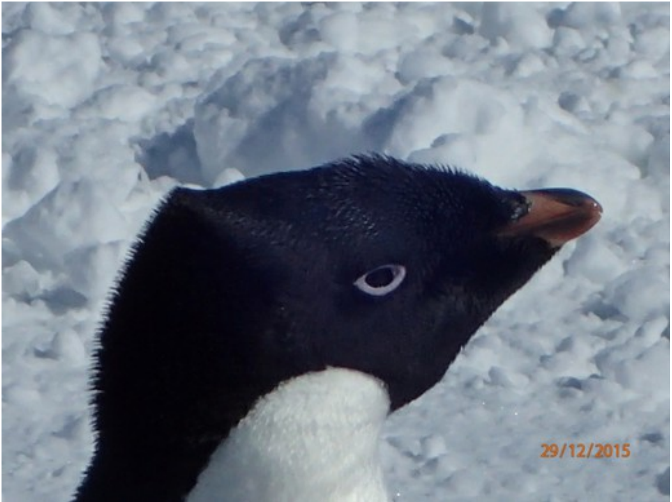
Foto 17: Primo piano di un pinguino Adelia