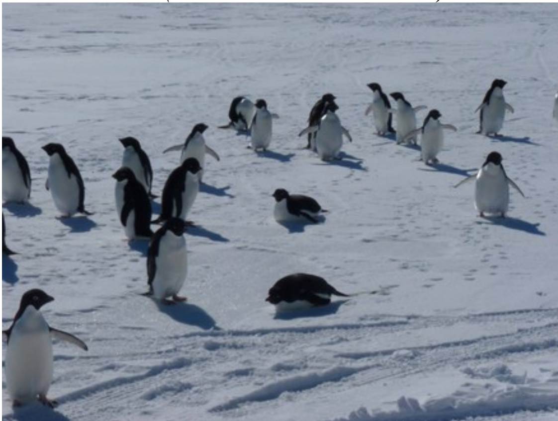
Foto 13: Pinguini sul pack davanti alla stazione Mario Zucchelli. Due sono intenti a scivolare sul ghiaccio usando la pancia come uno sci