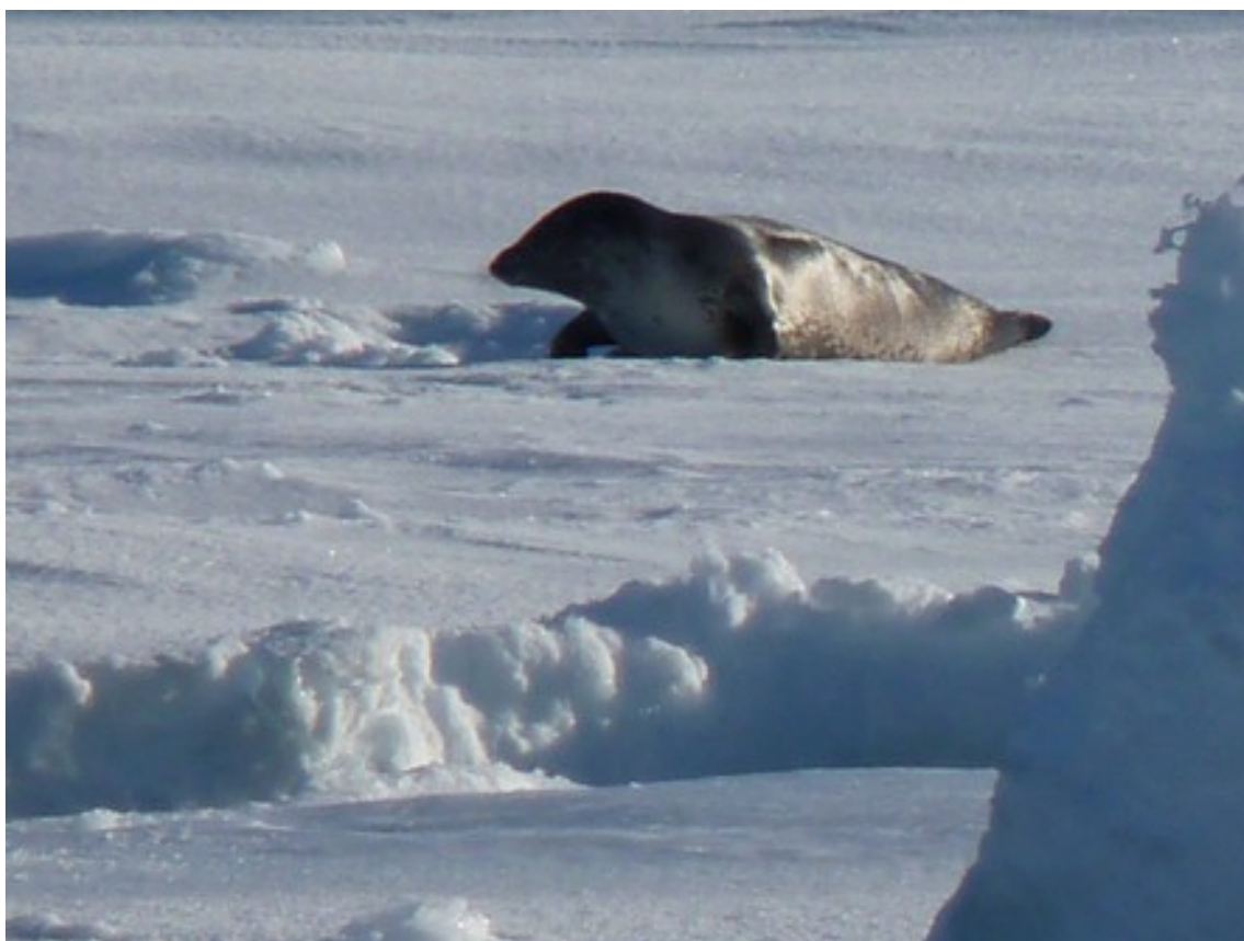
Foto 10: Foca dispersa sul pack che prova a scappare dopo avere visto la nave