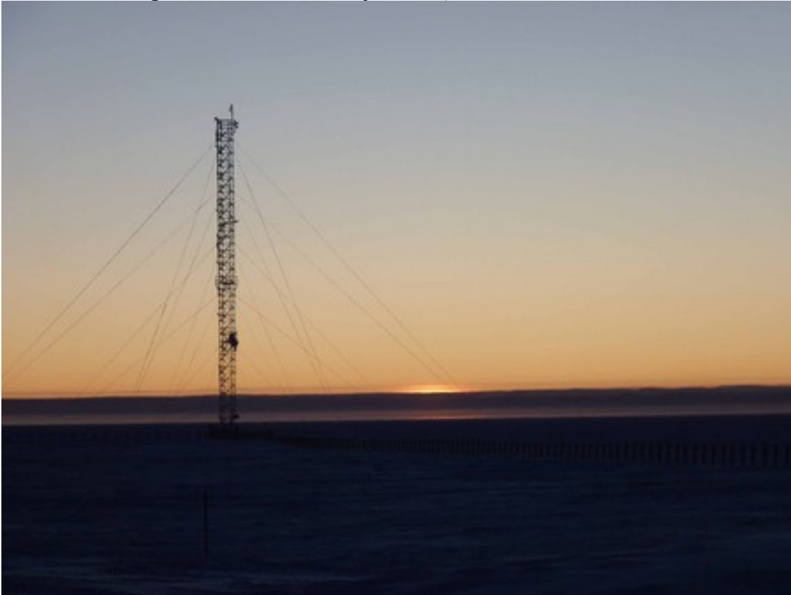
Foto 31: Tramonto dietro alla torre americana che è alta circa 45 metri e sulla quale sono disposti svariati strumenti scientifici