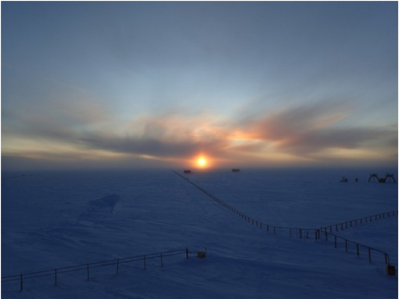
Foto 24: Tramonto e nuvole alle spalle dei laboratori esterni